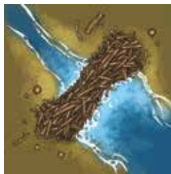
The Beaver Dam

When a player plays the Beaver Dam, he immediately receives one Reward token of his choice.