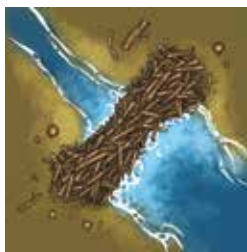
Le Barrage de Castor

Lorsqu'un joueur pose le Barrage de Castor en jeu, il reçoit immédiatement un jeton Récompense de son choix.